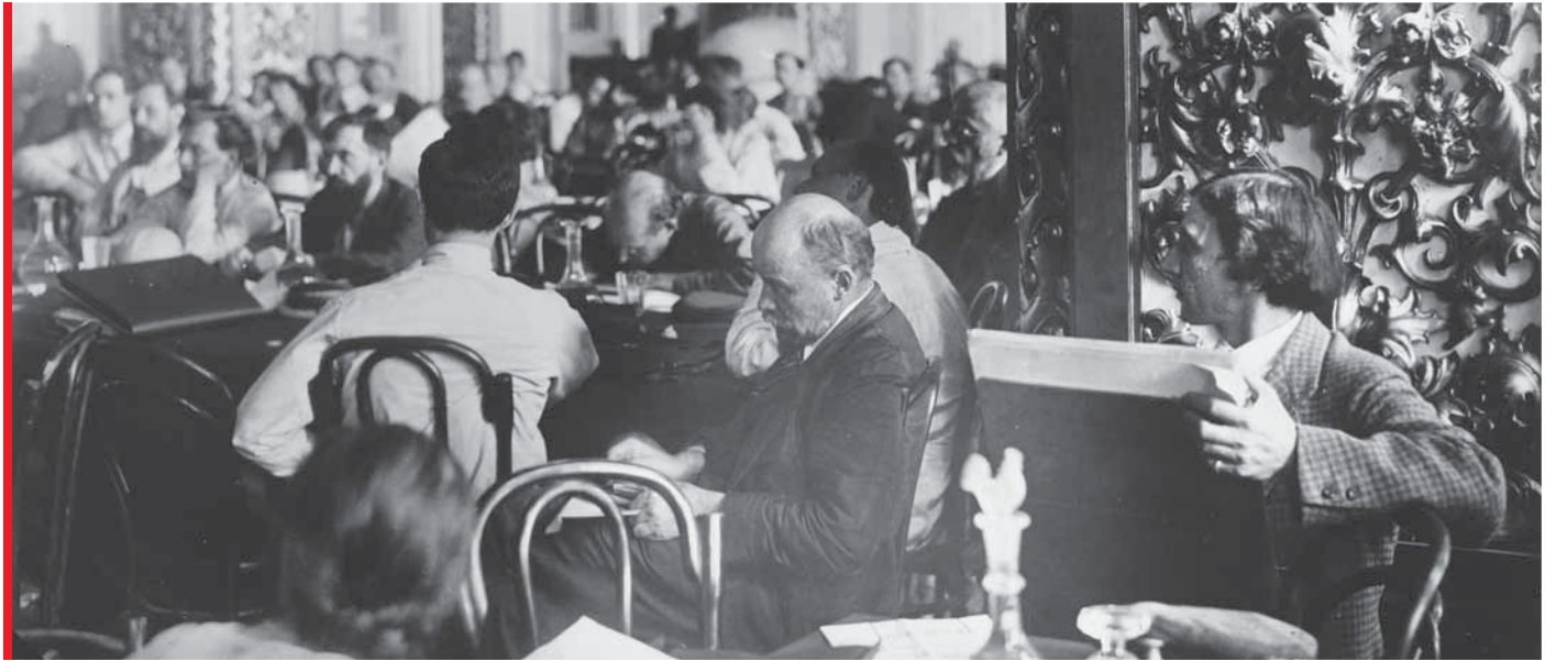
W.I. Lenin (M.) bei einer Parteikonferenz im Kremlin, 1920

ist nicht möglich ohne Hoffnung auf ein Regierungsprojekt, das seinerseits auf gesellschaftliche Bewegungen angewiesen ist. Deshalb wird die rechte Rechte in vielen Ländern so stark und organisiert ihrerseits Gegen-Hegemonie.