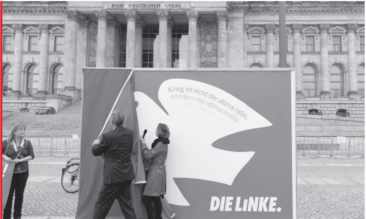
Die Parteivorsitzenden vor dem Reichstag in Berlin, 1.9.2014

Ja, ich weiß, die Forderung nach einer linken Regierung in Deutschland klingt absurd. Die SPD ist seit 2005 getreue Mehrheitsbeschafferin der CDU und hat selbst 2002 mit ihrer Agenda 2010 die neoliberale Wende der Politik in Deutschland vollendet. Von Sigmar Gabriels ursprünglicher Strategie, die Mitte der Gesellschaft für ein linkes Projekt zu gewinnen, ist nichts geblieben. Nicht Umgestaltung, sondern Stabilität und Sicherheit stehen im Zentrum seiner Politik – und dies auf immer unsichereren neoliberalen Grundlagen. Die Führung der Grünen sieht schwarz als Zukunftsfarbe und die AfD ist in den Umfragen auf 10% gestiegen. Und doch oder gerade deshalb bin ich der festen Überzeugung: Jetzt ist die Zeit gekommen, den Kampf für eine linke Regierung in Deutschland auf die Tagesordnung zu setzen. Dies ist die richtige Antwort auf eine rechte Gefahr.