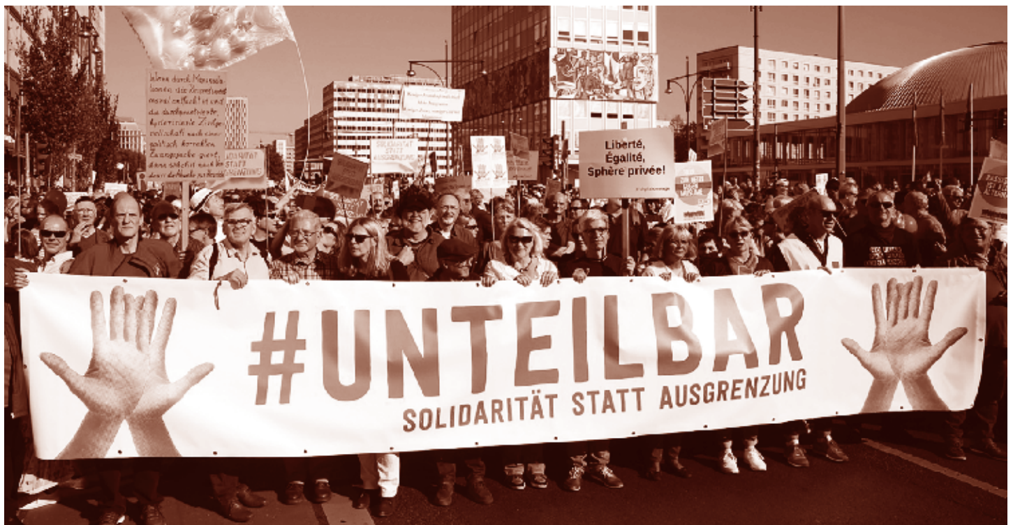
240.000 Menschen demonstrieren in Berlin, 13.10.2018

Die angesehene Wochenzeitung »Die Zeit« publizierte im Mai 2020 ein Gespräch mit Saskia Sassen und Richard Sennett über ihre Leben unter Corona-Bedingungen. Interessant ist diese Gesprächsrunde nicht nur wegen ihrer prominenten Teilnehmer*innen. Zweifelsohne gehören die Interviewten zur Prominenz des globalen intellektuellen Diskurses. Doch die Leser*innen erfahren durch dieses Gespräch mehr, als die Interviewer fragten. Es bringt, wohl gegen die Intention der Sprechenden, einen Widerspruch des sozialen Lebens in der Pandemie zum Ausdruck. Als die Zeit-Redakteure wissen wollten: »Saskia Sassen und Richard Sennett, wie haben Sie die vergangenen Wochen der Isolation verbracht?«, antwortete die Erstgenannte: »Es war ehrlich gesagt himmlisch.« Und Richard Sennett fügte hinzu: »Wir haben jeden Tag lange Spaziergänge durch die verlassen Straßen von London gemacht.«