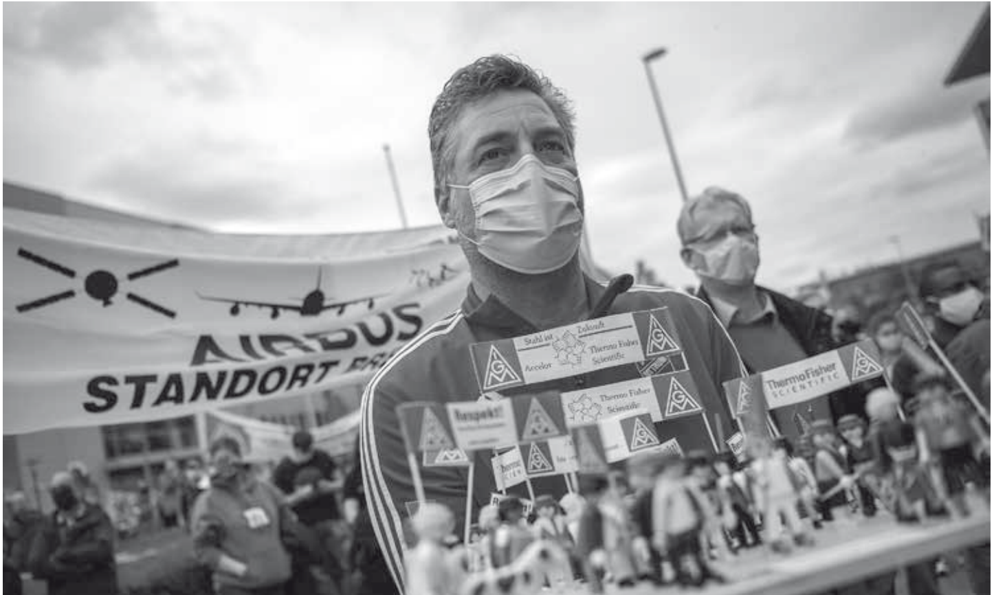
8.7.2020: Protestkundgebung der IG Metall bei Airbus, Hamburg-Finkenwerder

In der Tarifrunde 2018 hatten die Gewerkschaften ein Comeback tariflicher Arbeitszeitpolitik eingeleitet. Zwei Jahrzehnte des Rollbacks wurden beendet. Dabei ging es zunächst »nicht mehr vorrangig um kollektive Arbeitszeitverkürzung, sondern um Arbeitszeitgestaltung, um Wahlmöglichkeiten zwischen Geld und freier Zeit und Entlastung für einzelne Beschäftigtengruppen«. 1 Nicht zuletzt die großen Beschäftigtenbefragungen der IG Metall haben vielfältige Bedürfnisse nach individuell steuerbaren Zeitarrangements zum Ausdruck gebracht. Der Tarifabschluss musste gegen den Widerstand der sich noch im Konjunkturaufschwung befindlichen Unter-