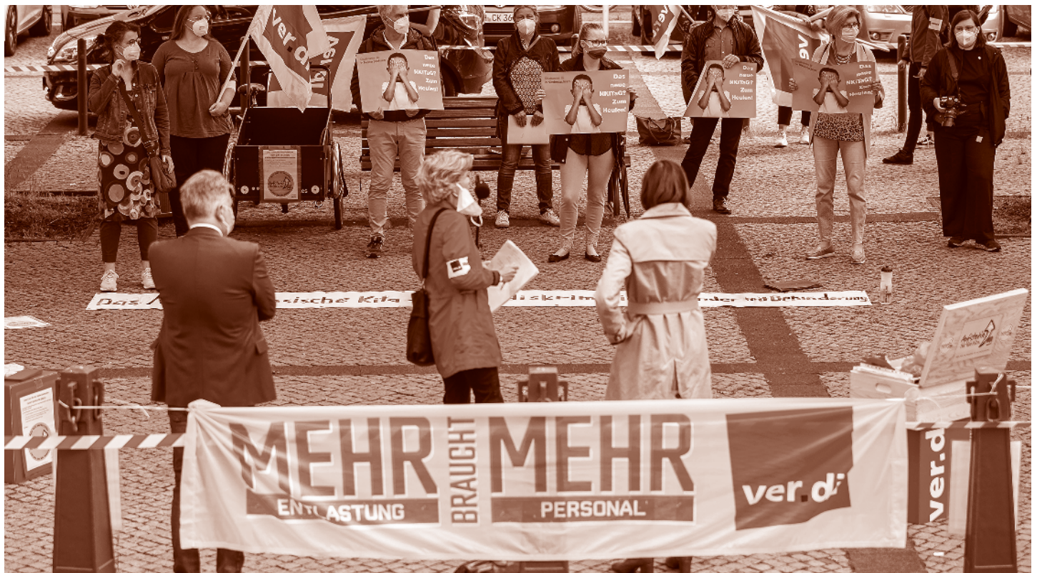
Hannover, 9.6.2021: Erzieher:innen demonstrieren vor dem niedersächsischen Landtag