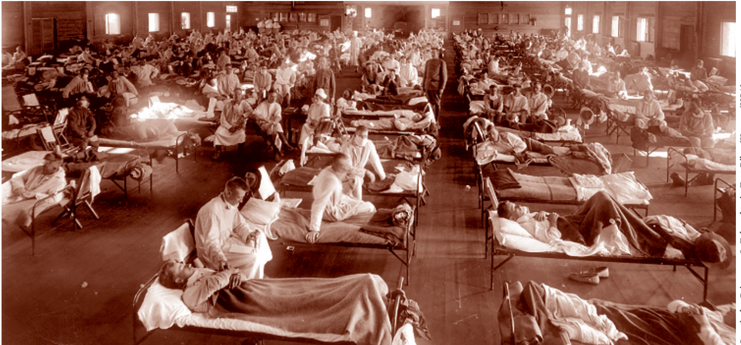
Spanische Grippe 1918, Erkrankte in Fort Riley (Kansas/USA)

Die Zahl der weltweit neu gemeldeten Coronavirus-Fälle ist nach Angaben der Weltgesundheitsorganisation (WHO) weiterhin explosionsartig gestiegen. Bis Mitte Januar 2022 wurden weltweit über 328 Mill. bestätigte Fälle von COVID-19 gemeldet, darunter über 5,5 Mill. Todesfälle. Die Entwicklung der vierten Corona-Welle auf Basis der Omikron-Mutation hat in Europa und den USA die Infektionszahlen in bisher unbekanntem Höhen schießen lassen. In der medialen Öffentlichkeit reagierte man mit einer differenzierten Berichterstattung über den Charakter von Viren, die Bekämpfung von Seuchen in der Vergangenheit etc., und rückt diese Fragen dankenswerterweise mehr in den Vordergrund der gesellschaftlichen Debatte, nachdem sie jahrzehntelang kaum wahrgenommen wurde. Hier leistet Philipp Kohlhöfer mit seinem Buch »Pandemien: Wie Viren die Welt verändern« 1 einen wichtigen Beitrag. Das Vorwort