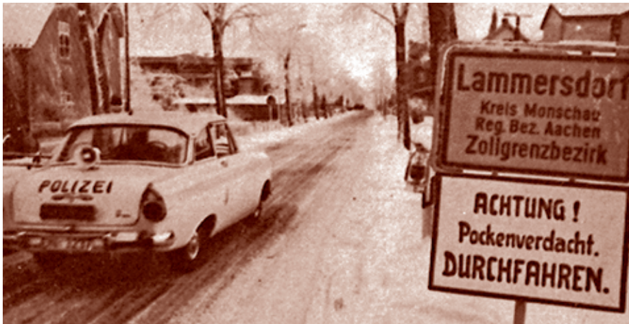
Pocken-Epidemie in der Eifel 1962

Körper empfinden. Im vorigen Jahrhundert gab es allerdings auch bereits Impfkritiker, die das Impfen gar nicht an sich völlig ablehnten. Aber dagegen waren, dass der Staat sie dazu zwingen wollte. Denn nicht ganz ohne Berechtigung reklamierten sie das Recht auf Selbstbestimmung über ihren Körper.« 10