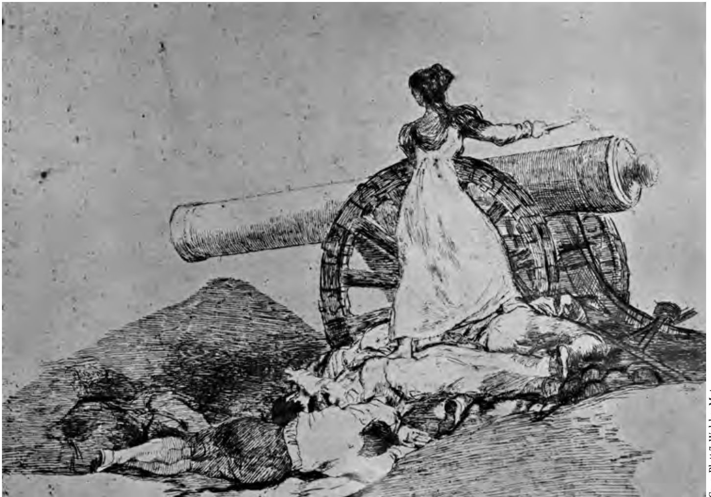
Coya, Blatt 7: Welcher Mut

Seit dem Überfall steht im Westen Versorgungssicherheit politisch wieder vor Klimaschutz. Ein rascher Ausstieg aus der Kohleverstromung ist fraglich geworden, selbst verlängerte Laufzeiten für Atomkraftwerke sind wieder eine Option. Vorrang vor einer friedlichen, inklusiven Gesellschaft (Sustainable Development Goals 16) hat nun auch in Deutschland wieder die Aufrüstung. Laut Bundesregierung soll das Zwei-Prozent-Ziel der NATO bei den Rüstungsausgaben noch übertroffen und dem Militär zusätzlich ein Sondervermögen von 100 Milliarden