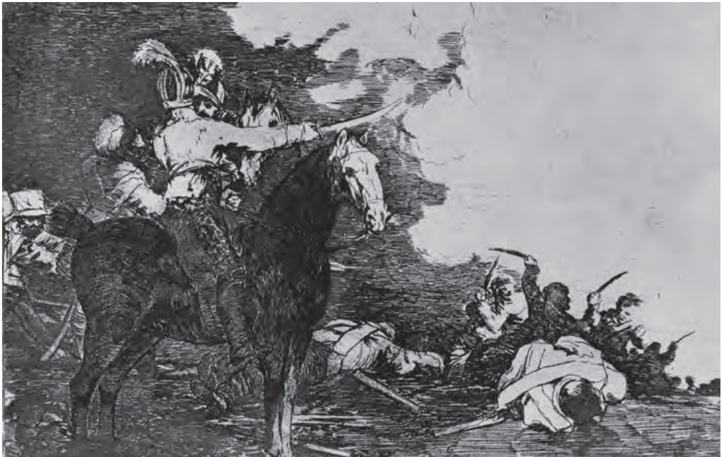
Goya, Blatt 17: Sie können sich nicht einigen

zurückschlagen. Das könnte dem Expansionismus Putins allmählich die Massenloyalität entziehen, doch der Westen wird ebenfalls Schaden nehmen.