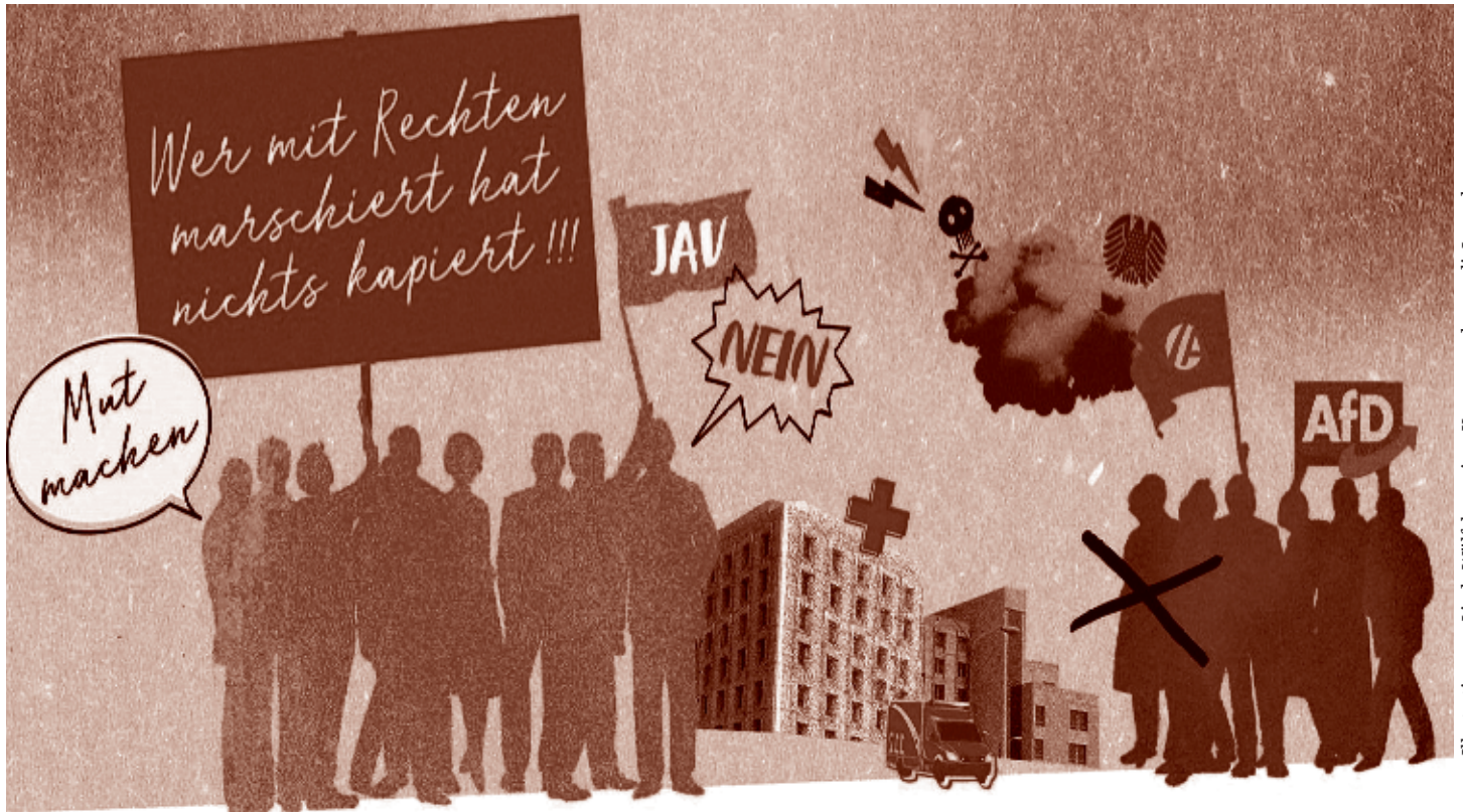
Illustration von Linda Wölfel aus einer Kampagne der ver.di-Jugend

Der gesellschaftliche und politische Rechtsruck, den wir gegenwärtig erleben, verläuft keineswegs geradlinig; es gibt Gegenbewegungen, Widerständigkeit, Kampf und demokratisches Aufbegehren. Unübersehbar ist jedoch auch: Das Wiedererstarken von Die Linke beruht auf einem Umverteilungseffekt innerhalb des linken Lagers. Neben dem Generationenwandel haben die Erosion der Sozialdemokratie und die Schwäche der Grünen Chancen für die eine Linkspartei geschaffen, die sich dem Rechtsruck entschlossen widersetzt. Das ändert aber nichts daran, dass die Parteien mitte-links ihre Mehrheitsfähigkeit verloren haben.