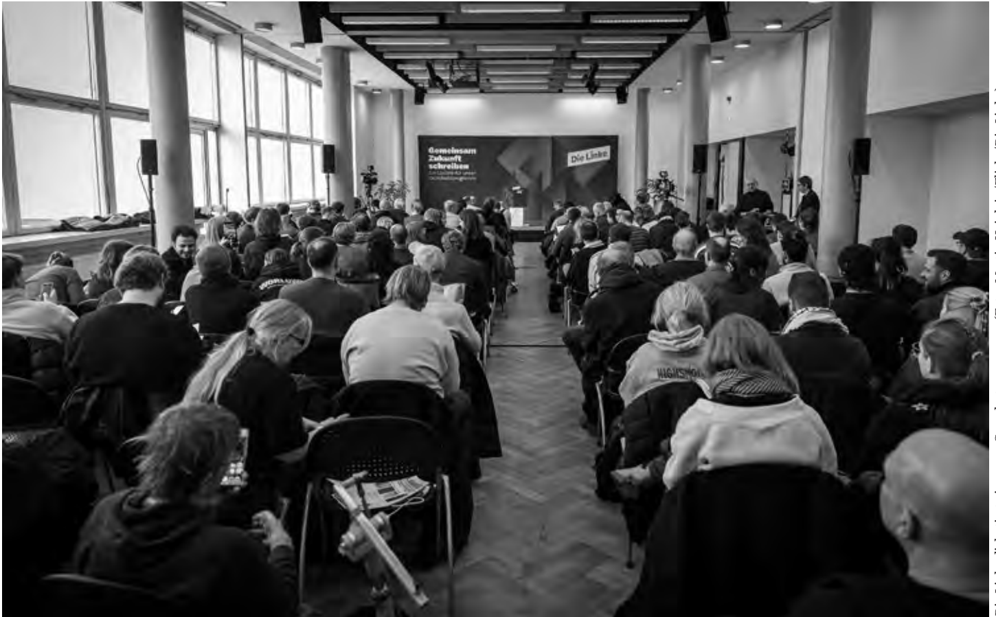
Die Linke diskutiert ein neues Grundsatzprogramm

Ich möchte im Folgenden mit einer weitergehenden, mittel- und langfristigen Perspektive einige Bewährungsproben benennen, vor denen aus meiner Sicht die Linke steht und die es programmatisch, strategisch und politisch praktisch zu bewältigen gilt. Meine Kernthese dabei lautet: Linke programmatisch orientierte Politik sollte sich als transformative Kraft verstehen, als Kraft, die die sozialen, ökologischen und alltagskulturellen Verhältnisse in Richtung von Gerechtigkeit, Nachhaltigkeit und Anerkennung umzuwandeln trachtet. Nicht die Verteidigung des Status quo, sondern die Veränderung, die radikale Verschiebung von Kräfteverhältnissen, Strukturen und Normen in dieser Gesellschaft nach links müssten in den Zeilen und zwischen den Zeilen eines neuen aktuellen Programms zu finden sein.