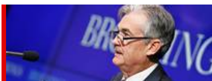
Jerome H. Powell, Präsident der Fed. Foto:

Die US-amerikanische Notenbank (Fed) hat auf ihrer ersten Sitzung im neuen Jahr keine Veränderung der Zinsen beschlossen und darüber hinaus der nationalen Kreditpolitik eine »Atempause« verordnet. Der Prozess zur Normalisierung der Zinspolitik und der Fed-Bilanz ist also vorerst unterbrochen.