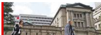
Bank of Japan

In Reaktion auf die COVID-19-Pandemie, die Politik des gesellschaftlichen »Lockdowns«, werden die US-Federal Reserve unbegrenzte Mengen an US-Schatzleihen, die Bank von England britische Staatsanleihen im Volumen von 200 Mrd. Pfund Sterling und die Europäische Zentralbank Anleihen der Euroländer im Umfang von bis zu 750 Mrd. Euro aufzukaufen.