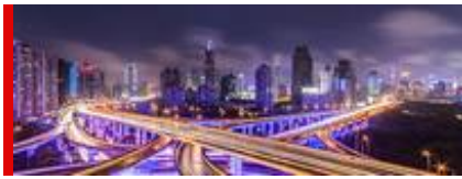
Wirtschaftsmetropole Shanghai.

In den vergangenen drei Monaten ist das chinesische Bruttoinlandprodukt (BIP) im dritten Quartal gegenüber dem gleichen Zeitraum des Vorjahres um 6% gewachsen. Das ist langsamer als allgemein erwartet wurde.